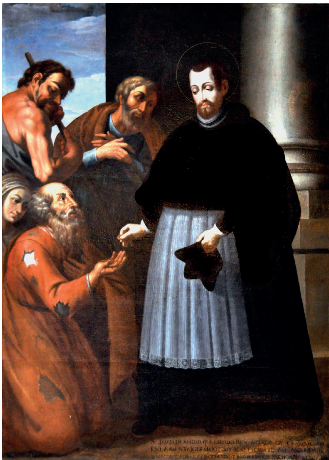
Fig. 5. Óleo sobre lienzo. Círculo de Mateo Cerezo. S. Juan de Sahagún dando limosna a los pobres , mitad del siglo XVII, Iglesia de Santa Águeda (Burgos, España), Fotografía Antonio Iturbe Saiz.

Este óleo es atribuido a Mateo Cerezo, de la segunda mitad del siglo XVII, «pero, más bien, parece sea obra del círculo del pintor» (Pascual-García (2019), p. 318), que representa a San Juan de Sahagún como canónigo, vistiendo sobrepelliz sobre el hábito y ejerciendo la caridad, con el bonete en la mano izquierda. Así Juan de Sahagún se convierte en defensor de los necesitados y afligidos. En el cuadro aparecen tres hombres y una mujer. (Fig. 5).