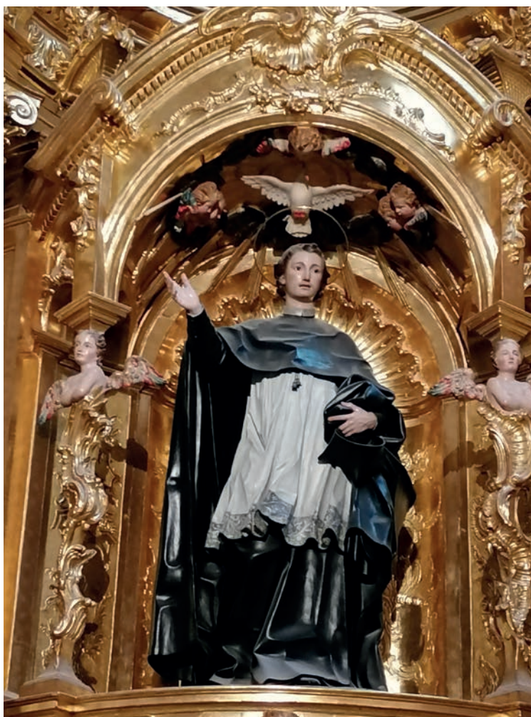
Fig. 1: Juan Pascual de Mena. S. Juan de Sahagún , 1769, Capilla de S. Juan de Sahagún de la catedral (Burgos, España).

Clemente XIV (1769-1774) concedía en 1774 privilegio de indulgencia al rezo ante este altar, colocándose una tarjeta tallada y dorada pendiente a un cordón indicándolo.