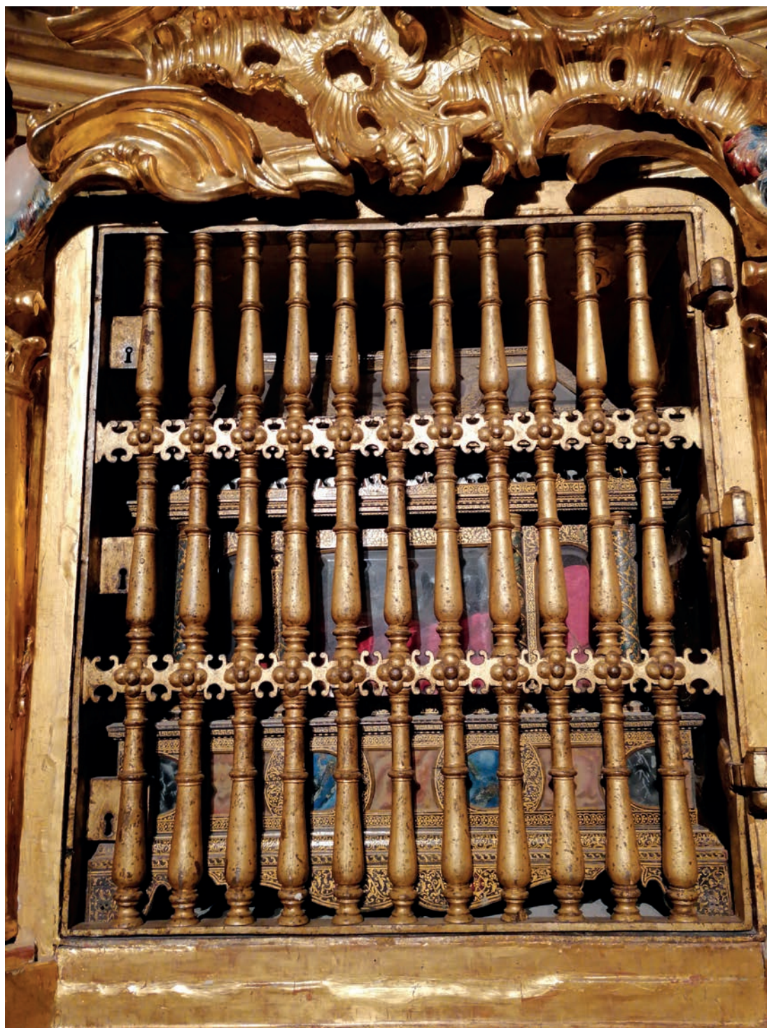
Fig. 2: Relicario. Reliquia de S. Juan de Sahagún, s. XVIII, Capilla de S. Juan de Sahagún de la catedral (Burgos, España).

Es una pieza del siglo XVIII, de notable interés según los patrones del Barroco clasicista. Obra de madera maquettata por dentro y fuera con columnas pareadas, entre ellas cristales biselados y en zócalo piedras de diversos colores. Está guardada con reja de hierro en el altar de su nombre (Id., (2007), p. 119). Presenta forma de arqueta que se remata con cubierta en forma de túmulo o artesa. Sus medidas: 53,7 x 42,3 x 11,50 cm. Sobre su policromía, sentido funerario (oro y negro, paraíso místico la decoración vegetal y animal (Id., pp. 120-121). (Fig. 2).